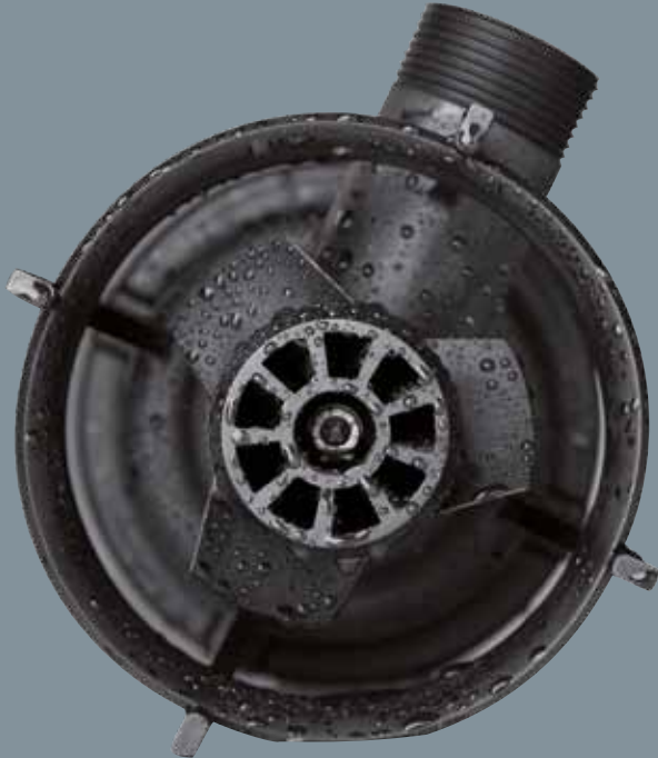
Leistungsfähiger Belüfter mit feinblasiger Belüftung